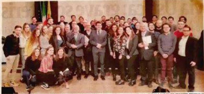
GLI STUDENTI CON I DOCENTI UNIVERSITARI E I RAPPRESENTANTI DEGLI ORDINI. SOTTO: I RAGAZZI PREMIATI CON I TUTOR E ALCUNI DEI PROGETTI PRESENTATI

«Una smart city è una città fondata sul capitale umano che contribuisce allo sviluppo urbano - ha detto il presidente dell'Ordine degli Ingegneri, Giuseppe Platania, sottolineando il valore sociale dell'iniziativa - Non basta la presenza delle infrastrutture materiali e digitali se non c'è l'intelligenza collettiva che partecipa, gestisce e all-